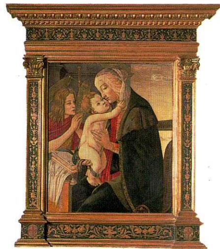
Sandro Botticelli e Escola - Madona com Menino e o jovem São João

Tudo o que se pode dizer a respeito da exposição Florença: Tesouros do Renascimento , que ocupará as salas do MARCS, é em termos superlativos. Muito raramente obras dessa importância deixam seus países de origem para serem expostas em outros locais, e é realmente extraordinária a oportunidade que se apresenta, agora, para entrarmos em contato direto com obras de alguns dos maiores gênios da arte de todos os tempos.