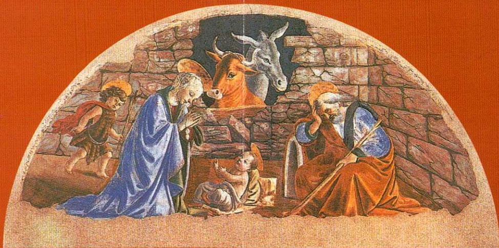
Sandro Botticelli - Nascimento de Cristo