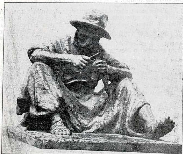
"O GUASCA" BRONZE DE CARÁTER REGIONALISTA