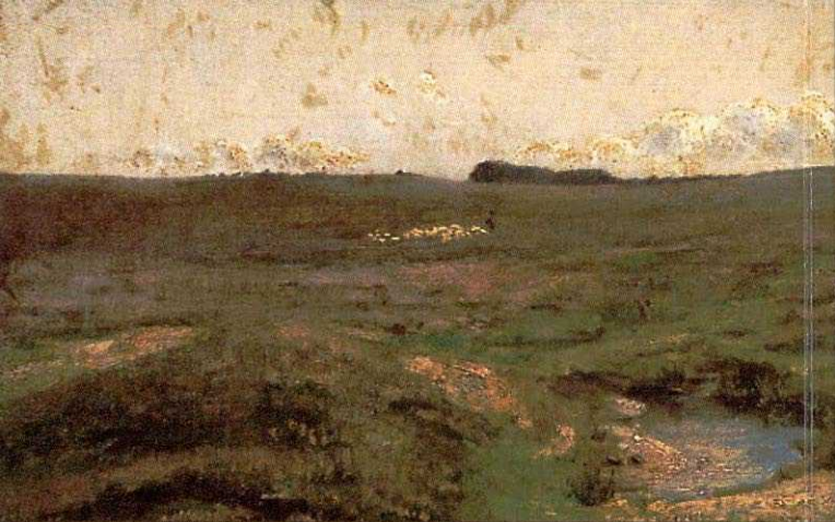
Marie-Rosalie Bonheur. La petite mare dans la plaine et troupeau de moutons, s.d (de)

O MARGS apresenta esta exposição de recorte temático em seu importante acervo, com um amplo conjunto de obras que mostram cenários rurais e urbanos, com trabalhos de 43 artistas, a maioria em pintura, mas também em gravura, desenho e fotografia. São visões diferenciadas de um dos temas mais importantes da História da Arte, a paisagem .