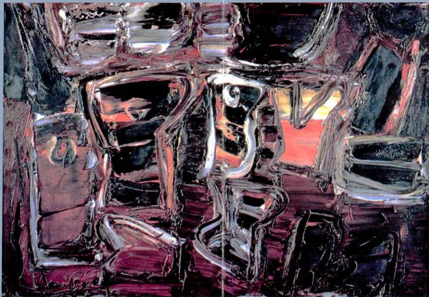
Iberê Camargo Objetos em tensão, 1967 Óleo sobre tela, 93cm X 132cm

Dando continuidade ao nosso propósito de apresentar ao público gaúcho, ao longo deste ano, um amplo panorama da pintura brasileira, trazemos agora ao MARGS uma amostragem extremamente significativa de obras do modernismo brasileiro pertencentes à coleção Gilberto Chateaubriand do Museu de Arte Moderna do Rio de Janeiro.