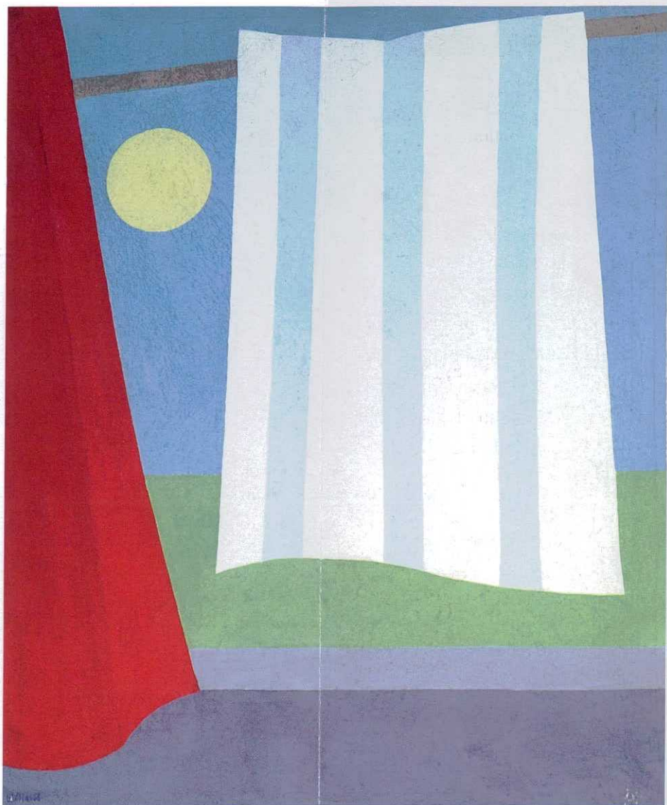
Walden Elias · Varal, óleo sobre tela, 1968. 65 x 54 cm