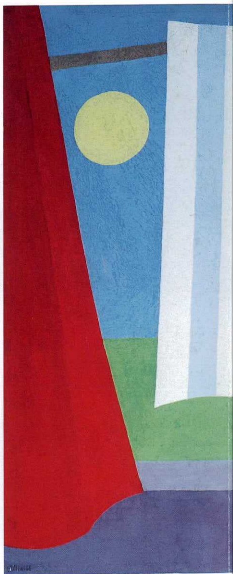
Waldely Elias · Varal, óleo sobre tela, 1968. 65 x 54 cm