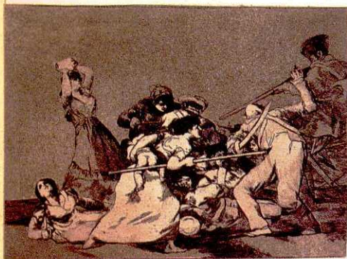
Goya y Lucientes, Francisco José de, 1746-1828. Los desastres de la guerra. Madrid : R'Academia de Nobles Artes de San Fernando, 1863. medida 25x35x3 cm

PICASSO, Pablo, 1881-1973. Carnet Picasso-Madrid, 1898. Barcelona : G.Gili, 1976. 2v., il, 11,3x17,7x2,5cm.