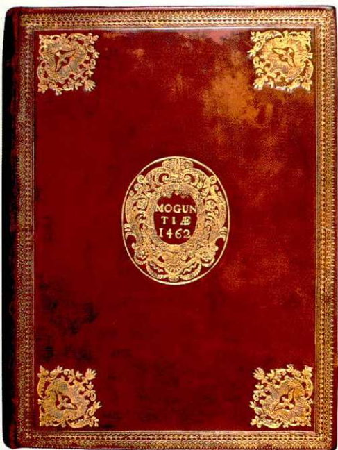
Bíblia de Mogúncia. Johann Fust e Peter Schoeffer. 1462. 2 vol. : pergaminho, 42x30x8cm.

Em latim. Letra gótica. Em pergaminho. 18,0 X 13,0 cm. (encadernação). Miniaturas, capitais ornamentadas, vinhetas, florões e cercaduras crisografadas. Adquirido em fins do séc. XIX. Catálogo de Exposição de Pergaminhos Iluminados e Documentos Preciosos, nº 12.