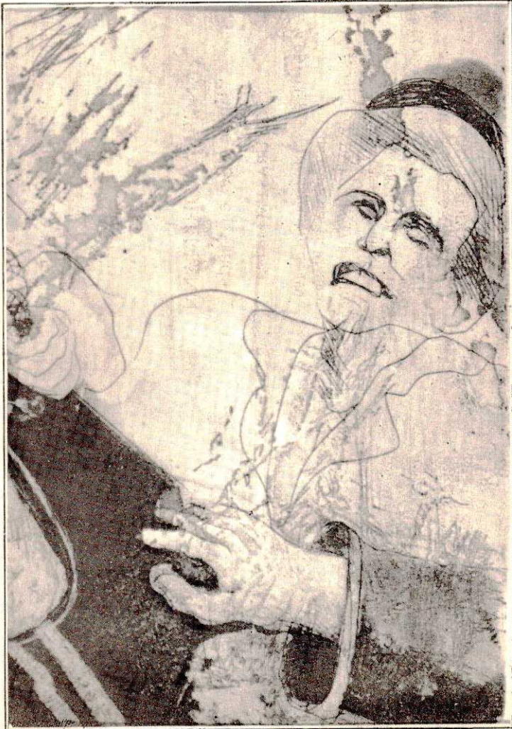
"HERANÇA DE UM DESCONHECIDO" Gravura em metal (30cm X 30cm) DETALHE