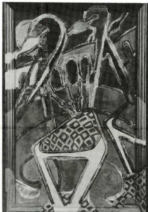
Pintura de Simone Rosa