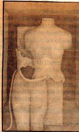
Tela de Loide Schwambach