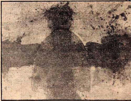
Pintura de Frantz em exposição no Margs

do opostos. Da mesma forma, o símbolo religioso universal da cruz, já visto em vários outros trabalhos do artista plástico, está presente outra vez, assim como vários outros. Todos podem ser conferidos até o dia 4 de setembro. A visitaçao no Margs vai de terças a domingos, das 10 às 17 horas.