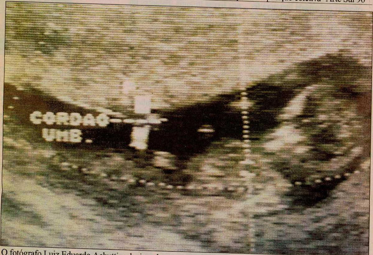
O fotógrafo Luiz Eduardo Achutti, selecionado para a mostra, enviou a ecografia de um bebê em gestação