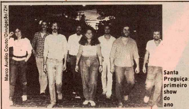
Santa Preguiça: primeiro show do ano

PEDRO BRUXO — de Henrique Schneider — Lançamento na Contemporânea Galeria de Arte e Decoração (Mariano de Matos, 11 — Novo Hamburgo), às 20h30min. Romance sobre o personagem Pedro, um andarilho e curandeiro.