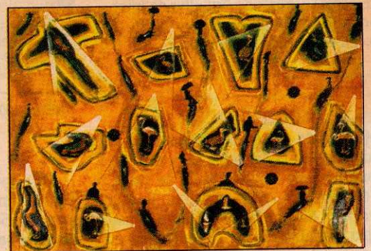
A repetição de temas é constante nas telas de Vieira

Presentes nas telas e em vitrines abertas estão as paixões do artista: pequenos aviões, caminhões, entre outros objetos. Já as fotografias expostas, segundo Vieira, representam as sombras que ficam escondidas de todo o processo de formação das imagens e que são responsáveis pelo surgimento de várias linguagens. Visitações de terças a domingos, das 9h às 19h.