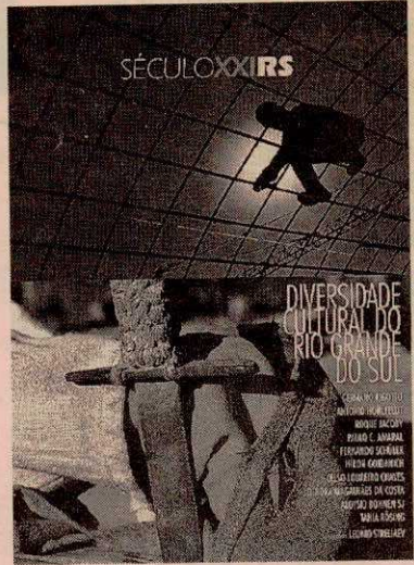
História da instituição é contada em livro tripartido