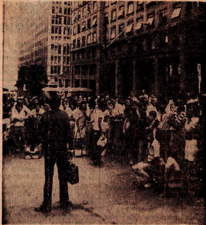
No original esta foto de Meditsch é a cores