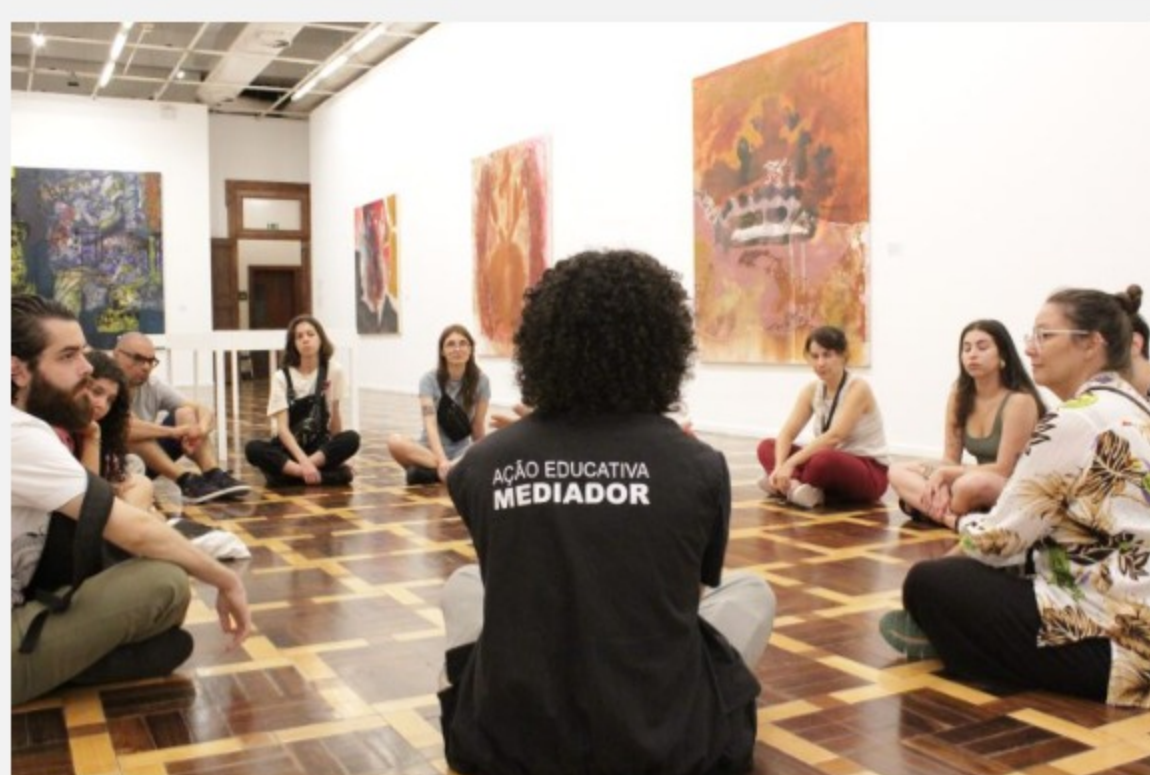
Mediação em travessia.

O Museu de Arte do Rio Grande do Sul (MARGS) vai promover uma programação especial para o mês de abril de 2024. Desenvolvidas pelo Núcleo Educativo e de Programa Público do Museu, as atividades são gratuitas e pensadas para atender aos mais diversos públicos, envolvendo ações de acessibilidade, oficinas de experimentação artística, mediações e sessões de documentário .