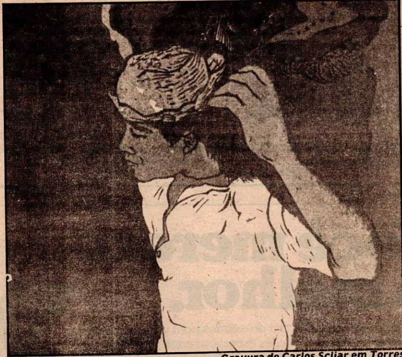
Gravura de Carlos Scliar em Torres

tem ainda como objetivos divulgar as tendências atuais da arte no Rio Grande do Sul e criar uma oportunidade de lazer cultural nas praias. O horário de visitação é de terças a domingos, das 16h às 22h. O Museu de Comunicação Social Hipólito José da Costa expõe no mesmo local O Humor e a Tradição do Rio Grande do Sul. ZH 23/01/82 2.º Cad. P. 2