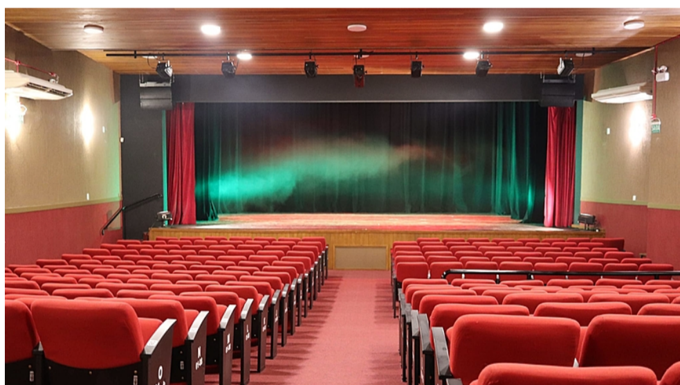
Teatro Municipal

28/11 - Atividade alusiva ao Dia da Música