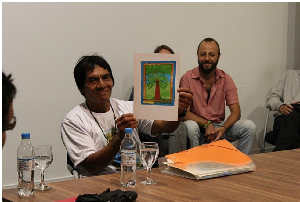
José Verá é o autor do livro "Nhemombaraete Reko Rã"