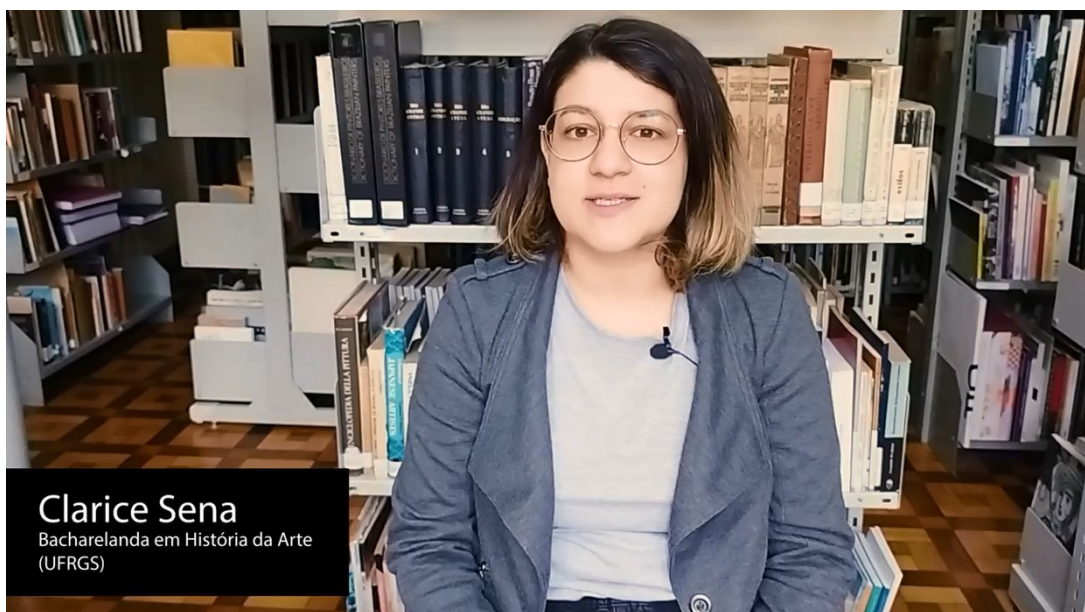
Frame do vídeo

https://www.instagram.com/reel/Ct92LVqsaak/?utm_source=ig_web_copy_link&igshid=MzRIODBiNWFIZA==