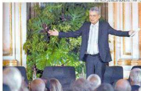
Chico Buarque recebeu a honraria no Palácio Queluz, em Portugal