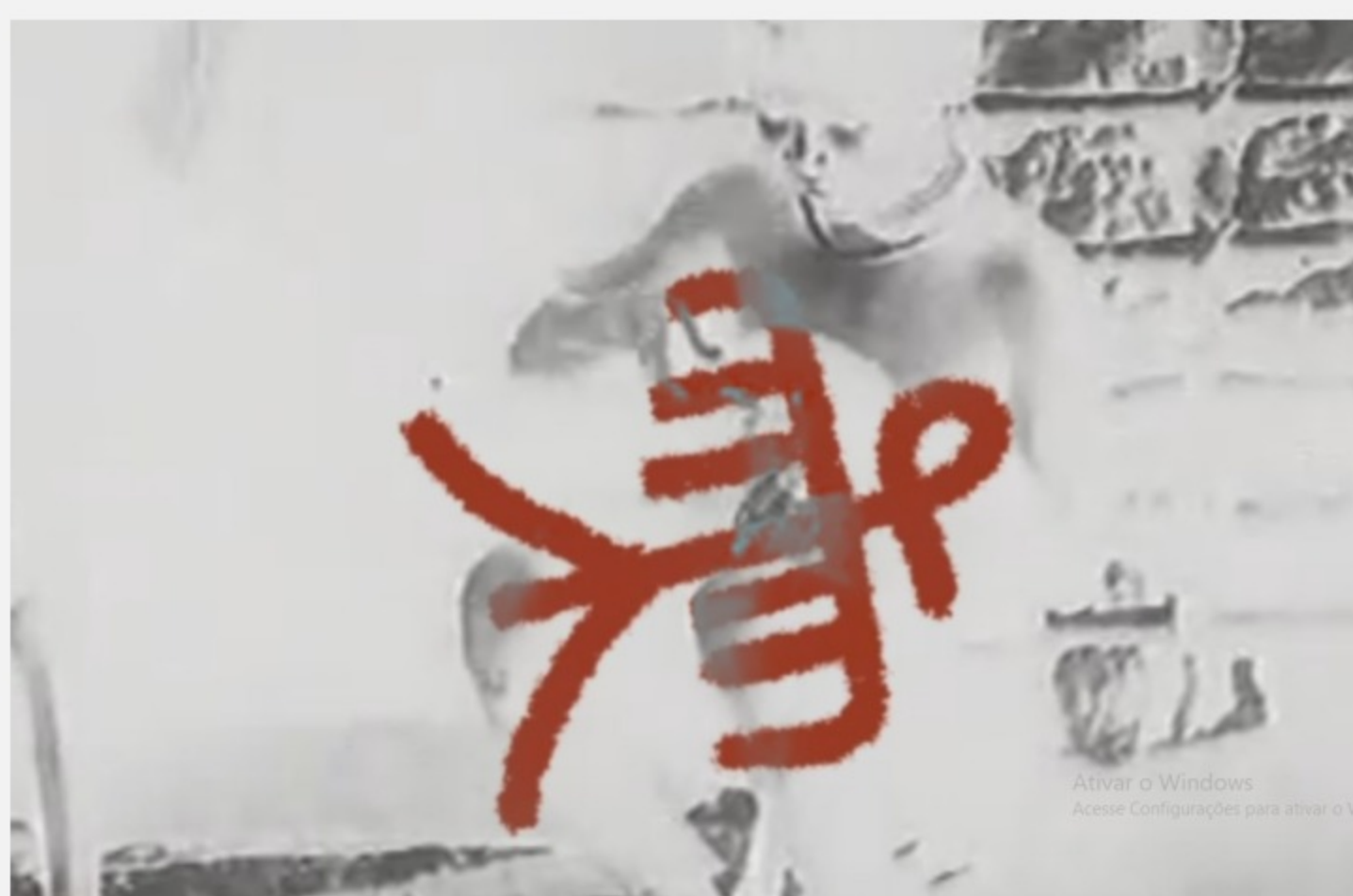
Video de Baniwa.

O Museu de Arte do Rio Grande do Sul (MARGS) lança o Programa Público de longa duração Mediação Crítica na quarta-feira (19/4) , às 14h , no Auditório do MARGS (2º andar do Museu), com uma atividade de apreciação coletiva e crítica a partir da obra Ty ty – Memórias de um beija-flor (2021), do artista Denilson Baniwa (1984).