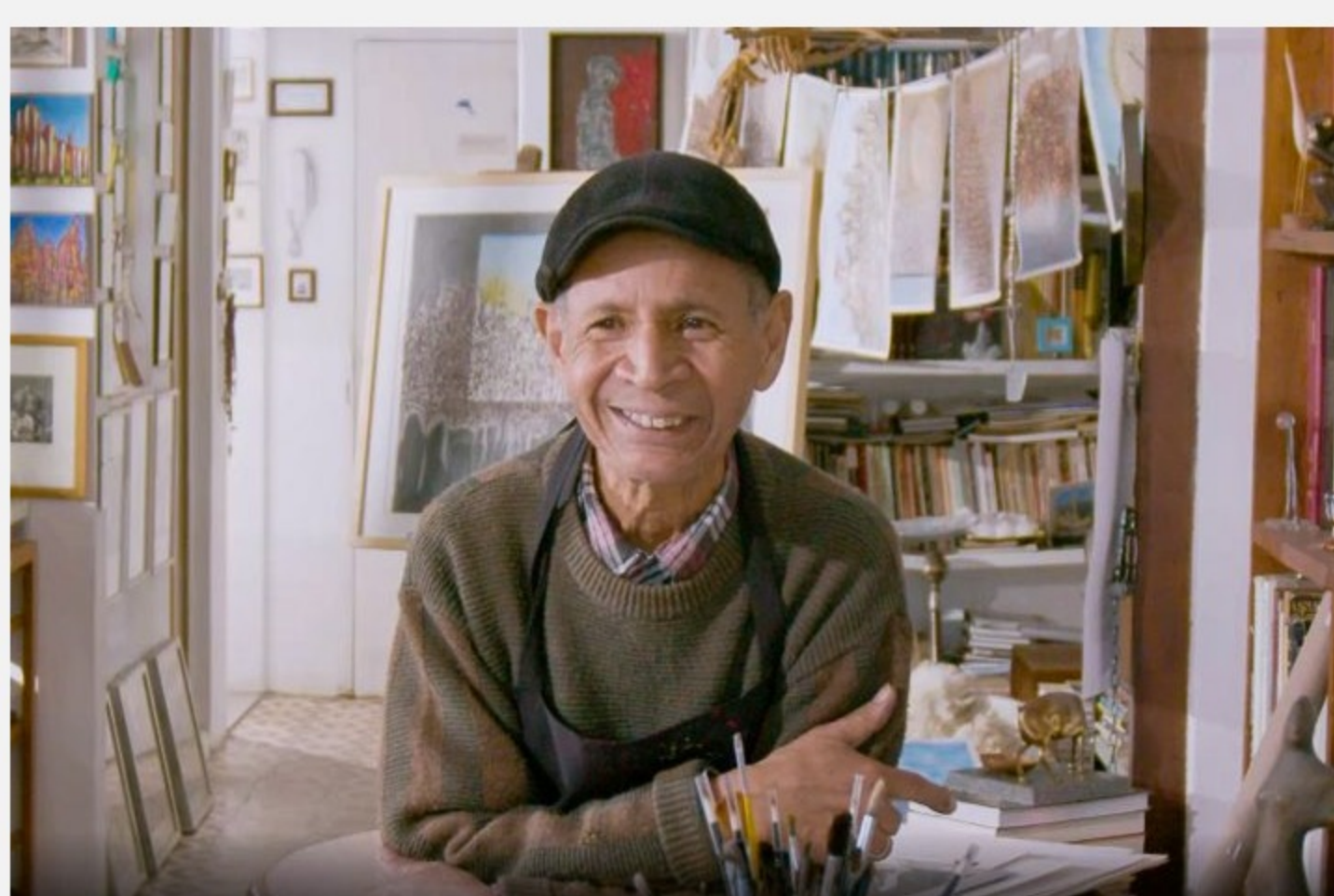
Paulinho Chimendes.

Nesta quinta-feira (18/8) , às 14h30 , o documentário Paulinho Chimendes – Meus Olhos Não São Suaves será lançado no Auditório do MARGS . A sessão de estreia contará com a presença do artista e realizadores. A entrada é gratuita , limitada a 60 lugares, por ordem de chegada.