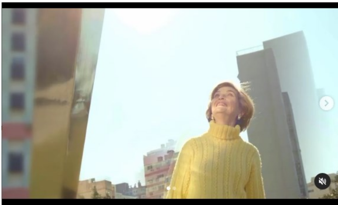
Frame do vídeo

https://www.instagram.com/p/CZjoCYCOynt/?utm_source=ig_web_copy_link