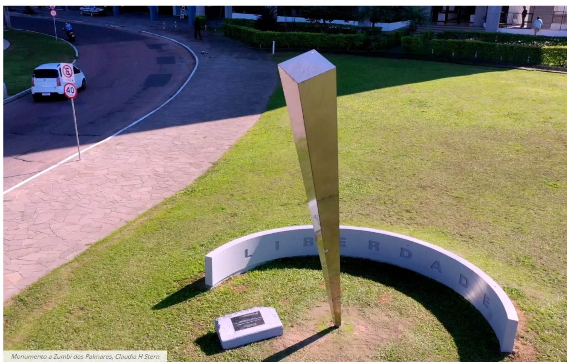
Monumento a Zumbi dos Palmares, Claudia H Stern