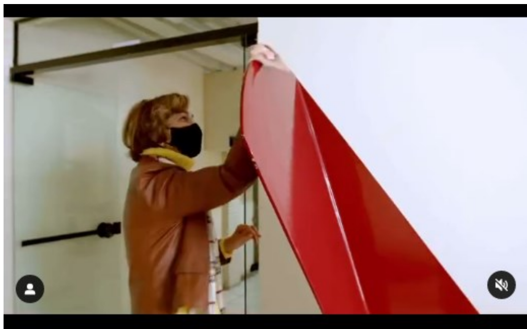
Frame do vídeo

Post 06: publicado em 04/03/2022, composto por um 01 card e legenda https://www.instagram.com/p/Car4mluDgP/?utm_source=ig_web_copy_link