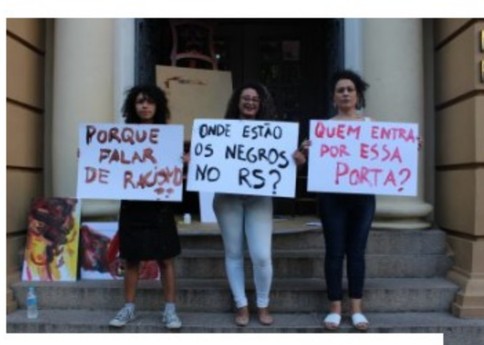
CONVERSA, OUTROS SEMANA DA CONSCIÊNCIA NEGRA - VIRTUAL - MARGS

Paralelamente, ao longo de fevereiro conteúdos sobre a artista, sua obra e o filme serão postados nas redes sociais do Museu (Instagram e Facebook), com o objetivo de ampliar e enriquecer a experiência proporcionada pelo curta.