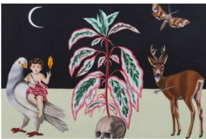
CARLA BARTH | CALAFIA ART STORE 📅 09/03/23 à 06/04/23