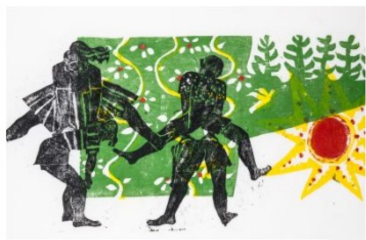
ZORAVIA BETTIOL | PORTO ALEGRE 📅 15/04/23 à 16/06/23