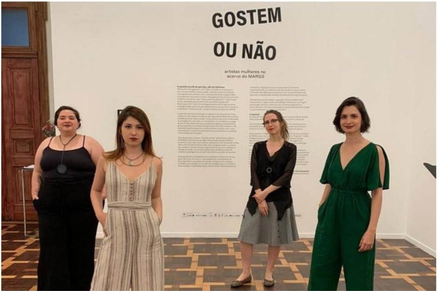
Exposição "Gostem ou não - Artistas Mulheres no Acervo do MARGs" ficará um mês em cartaz