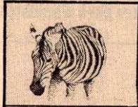
De Henry Moore