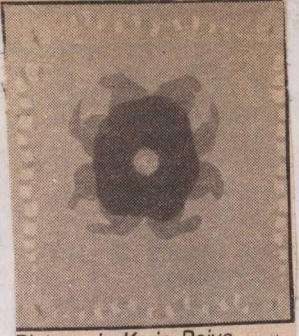
Pintura de Karin Paiva

COBRAS — Trabalhos de Karin Paiva, sob o título "Cobras e Lagartos",