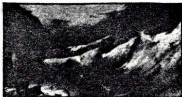
De Fayga Ostrower